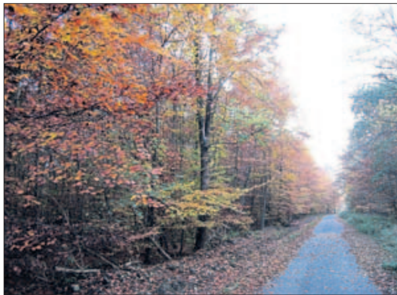
Unterwegs auf dem neu eingerichteten Eulenspiegel-Wanderweg im Elm war in diesen Tagen Leser Bernhard Peschel aus Königslutter.