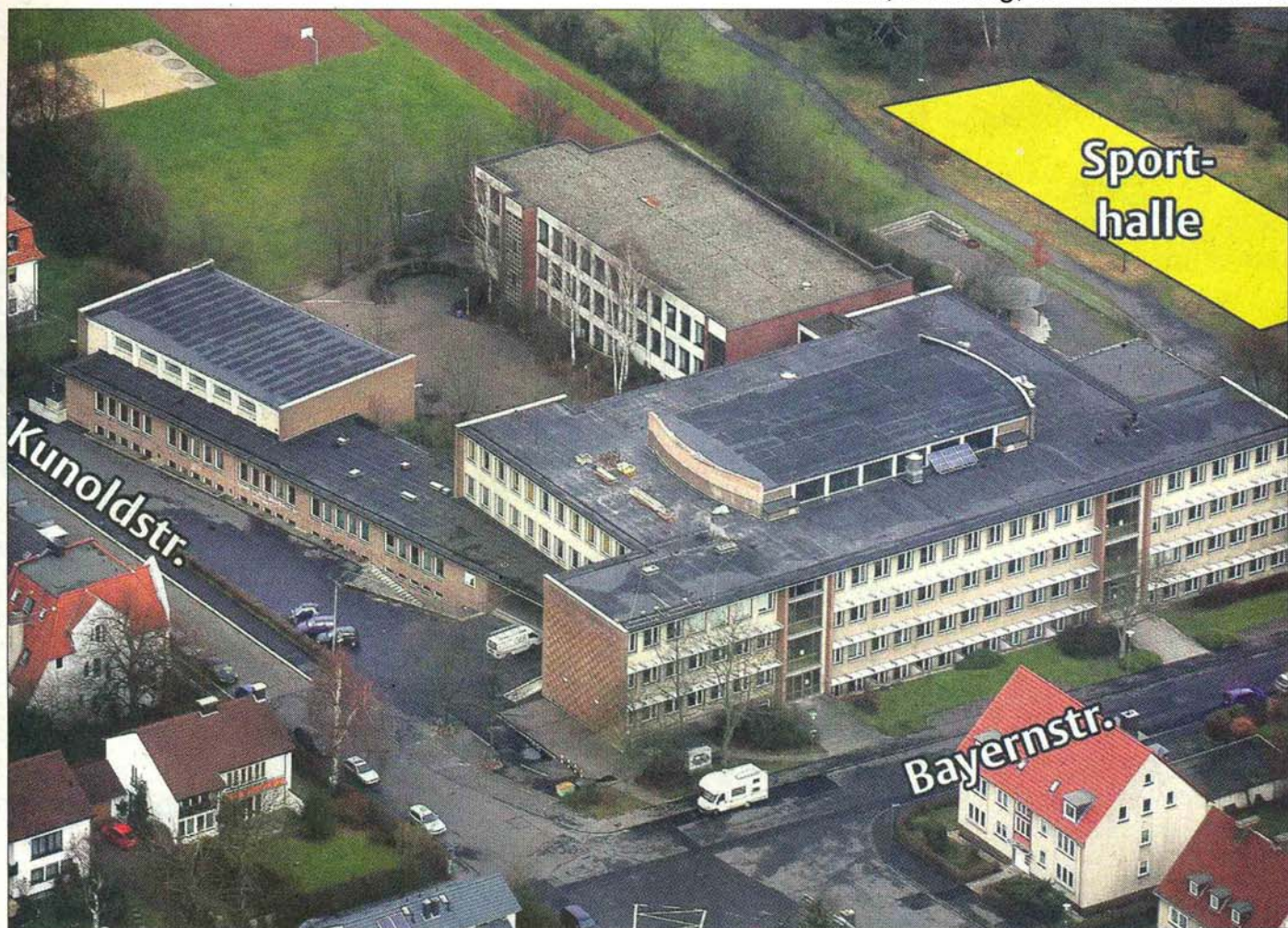
Der Standort: Die gelbe Fläche markiert das Grundstück für die Dreifelderhalle neben dem Wilhelmsgymnasium. Bis zum November 2009 soll die Halle, die zusammen mit der neuen Mensa 3,6 Millionen Euro kostet, stehen.